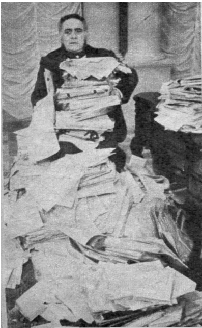
Tarelkin a saját „holttestétől” búcsúzik (Sinkó László)